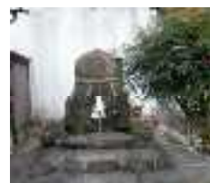
八軒町 猫石 姫を助けた猫の物語があります