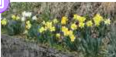
緑ヶ丘町 すいせんロード 平成 29 年、高山市民憲章協議会で表彰されました。