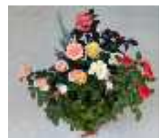
教養講座で作った寄せ植え バラが素敵です

お問合せ先：まち協事務局 0577-34-0114 minami-machikyo@hidatakayama.ne.jp