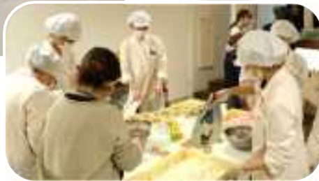
調理をする短大生→

富山国際大学子ども育成学部の学生が中心となり大学の学食を利用して今年四月から「ちよっこ おいでま こども食堂inキャンパス」を開催するにあたり、その経緯や協力いただいた方々を紹介するシンポジウムのようなものでした。学生達は食料確保が困難な事から、市社会福祉協議会へ相談しました。そこからJA氷見に相談が持ちかけられた結果、新しく「ベジタブルバンク」なるシステムがスタートしました。「ベジタブルバンク」とはJA組合員の農家が、出荷出来ない規格外の野菜を指定のJA支所に持ち込み寄付、これを市内のこども食堂が取りに行く事で野菜食材の供給ができる仕組みです。さらに、学食を運営管理する会社から調理施設