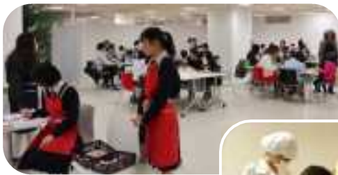
↑受付と配膳は高校