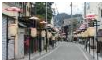
西町 山王祭の提灯の列 煌燐(こうけん)の文字が書かれています。(一歩)