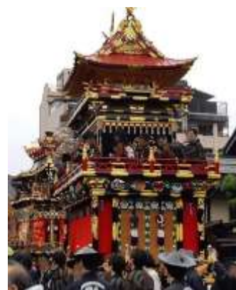
わたしの一枚 令和記念屋台曳揃え 青龍台 (川原町)

お問合せ先：まち協事務局 0577-34-0114 minami-machikyo@hidatakayama.ne.jp