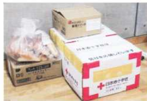
避難所に配布された備品

南小学校の避難所には1家族が、松倉中学校の避難所には4家族がそれぞれ避難しました。洪水の場合は浸水が始まると避難が非常に困難になります。早めの避難を心がけましょう。