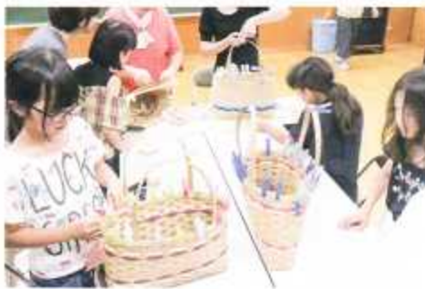
クラフトテープ かごバッグ講座(昨年度)

別表の通り、事業を予定していますが、新型コロナウイルスの影響で変更や中止となる場合もありますので予めご了承ください。 お知らせのチラシを閲覧やLINEでのメッセージで配布いたします。多くの方に参加いただけたらと思います。 申込は電話・FAX・メール・LINEで行えます。 今年も皆さまのご参加を、心よりお待ちしております。