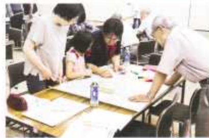
昨年度開催の防災DIGのようす

対策を踏まえた避難行動・ 避難所運営について、防災 委員会として災害時に地 域で何をするのか検討し 早期に体制整備をしてい きます。