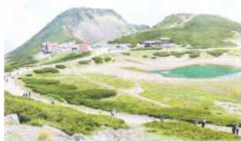
昨年度の乗鞍日帰りバスハイク

例年、青少年部は南小学 校児童を対象とした「子ど も体験教室」などの事業の 企画運営、各町内会の「子 ども会育成委員研修会や 「子ども会リーダー育成 研修会」を行っています。