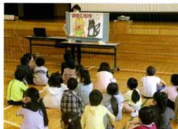
1年生：紙芝居で避難の合言葉「おかしもち」を学ぶ