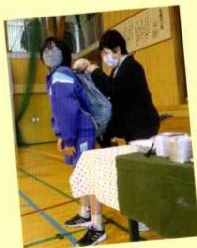
水入りのペットボトルが入ったリュックを背負ってみました。