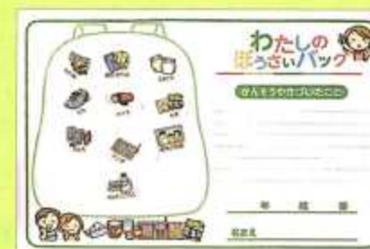
持ち物シール10個選んで貼ります