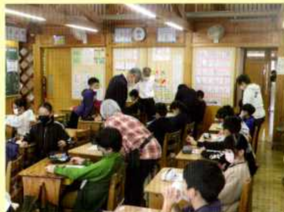
5年2組で家具の位置などを記入。