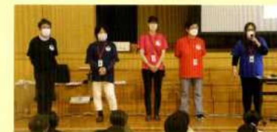
新宮・三枝・上宝・みなみ・大八まち協の事務局さん

9月29日(木)の2時間目に1年生、3時間目に2年生、4時間目に3年生の防災教室を開催しました。