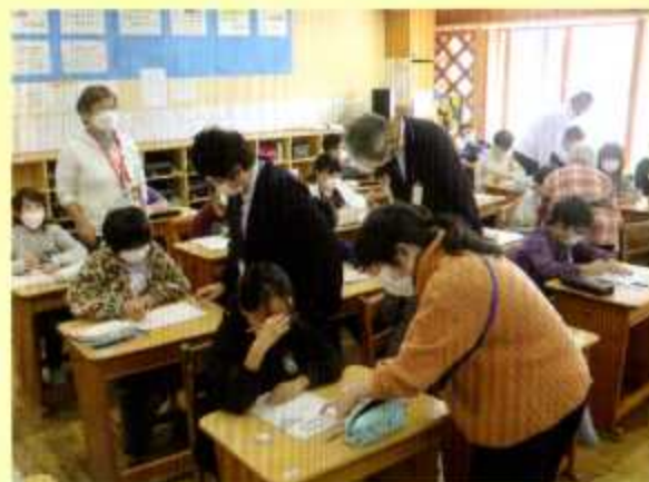
5年1組で防災士がサポートしています。