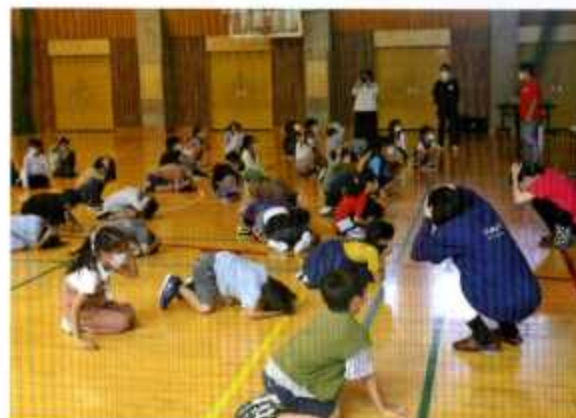
2年生：地震の時の防護姿勢を学ぶ