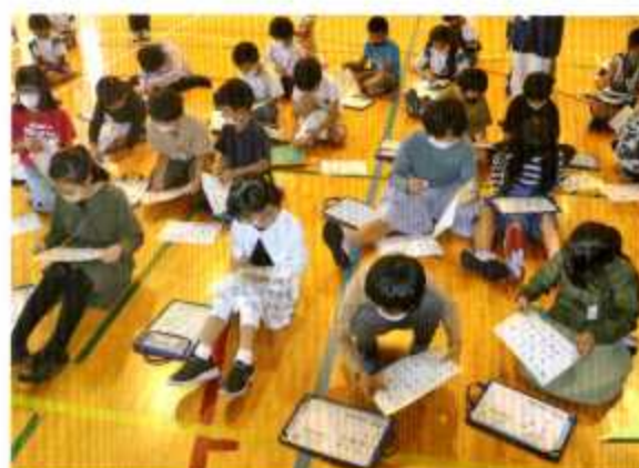
3年生：防災バッグの持ち物を選ぶ