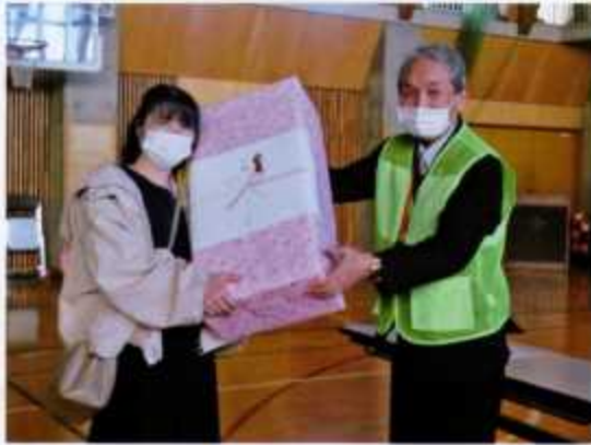
ふれあい文化祭のお楽しみ抽選会 一等賞品を渡す会長

うございました。みなみまちづくり協議会は南地区の子供からお年寄りまで、安心・安全な住みよいまちづくりを目指して活動してまいります。今後とも皆様の絶大なご協力、ご支援をお願いいたします。