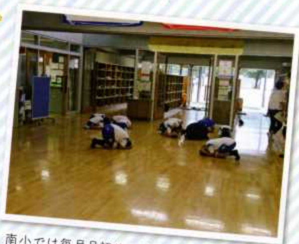
南小では毎月月初めに抜き打ちでシェイクアウト 訓練が実施されます。この日は掃除の時間中に… みんなその場でダンゴ虫ポーズ