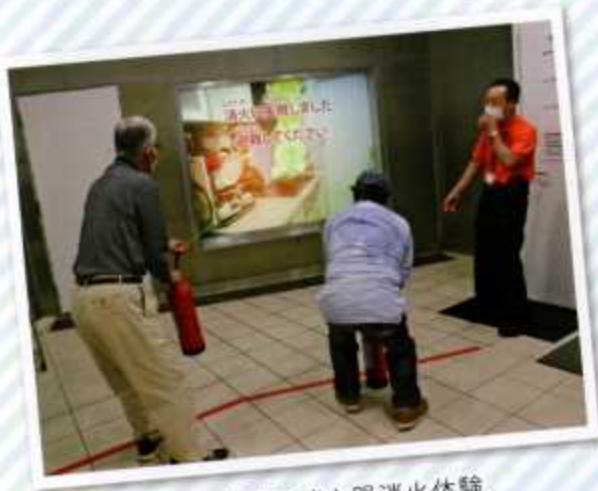
富山 四季防災館の消火器消火体験 初期消火に失敗し逃げる様に指示されました。